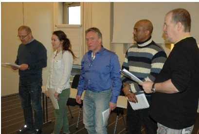
Fra presentasjon av prosjekt på et tidligere kurs.

Kursemner er fagbevegelsen oppbygning og virkemåte, det norske arbeidslivssystemet og internasjonale utfordringer. Vi ser på organisasjonen SAFE, og gjennomgår både struktur, aktuelle saker og prioriteringer. Dere møter også SAFEs ledelse og ansatte. Helse, miljø og sikkerhet er en del av kursinnholdet, det samme er lov- og avtaleverket. Forelesere er henholdsvis HMS-avdelingen og juridisk avdeling på huset. Dere får også en bolk med presentasjonsteknikk, og dere lærer om prosjektutvikling via jobbing med selvvalgt prosjekt som gruppearbeid. Det er dessuten satt av tid til eventuelle ønsker om innledninger på områdene fagforeningsarbeid/tillitsvalgtarbeid. Vi tilpasser med andre ord kursene etter deltakernes behov.